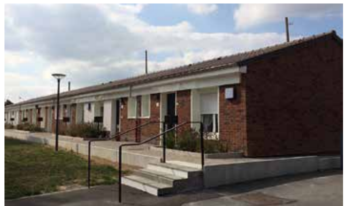
Contexte initial :