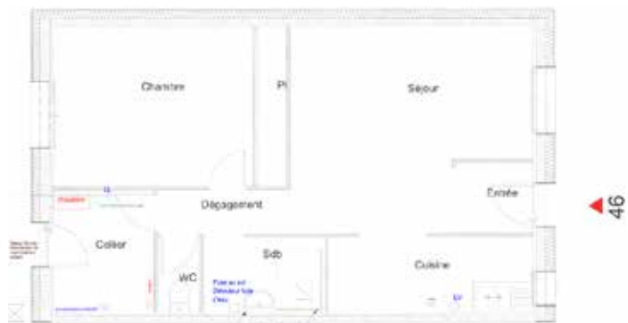
Plan réseaux électricité