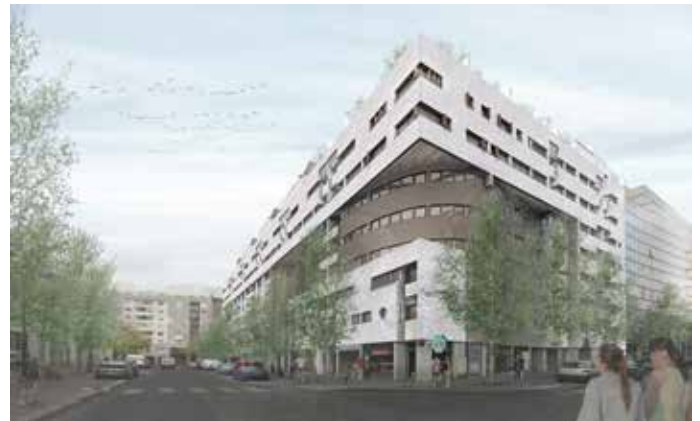
Maquette Numérique BIM: